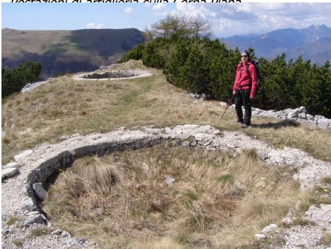
Postazioni di artiglieria sulla Corna Piana

Sulla linea Altissimo – M.te Vignola – Mori fu allestita la linea difensiva italiana. In quest'area si ritrovano le tracce di un fenomeno tipico dell'intero fronte lagarino: resti di opere difensive che gli austro-ungarici progettavano e cominciarono a realizzare ma che non riuscirono a completare a causa dell'arretramento precauzionale delle linee a inizio conflitto. Il monte Vignola ed il M.te Baldo avrebbero dovuto ospitare il sistema fortificato austriaco della Vallagarina su di una linea che sarebbe arrivata fino al Pasubio. Di fatto l'Impero austro-ungarico non riuscì a dare corso a questi progetti e nel 1915 le linee vennero fatte arretrare permettendo una rapida avanzata italiana.