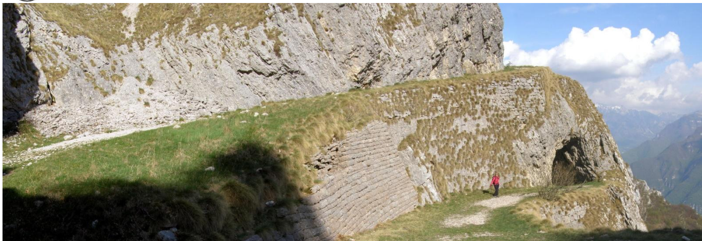
La strada militare che scende dal Corno della Paura

Questo itinerario circolare ci immerge in una zona molto interessante dal punto di vista ambientale e storico. Da un lato il Lago di Garda con il suo clima mite ed una vegetazione quasi mediterranea. Dall'altro i ripidi pendii della Val Lagarina dove si respira una atmosfera quasi dolomitica. A collegare il tutto una risalita con la funivia di Malcesine, cara quasi quanto bella, che ci consentirà di ridurre notevolmente il dislivello da pedalare.