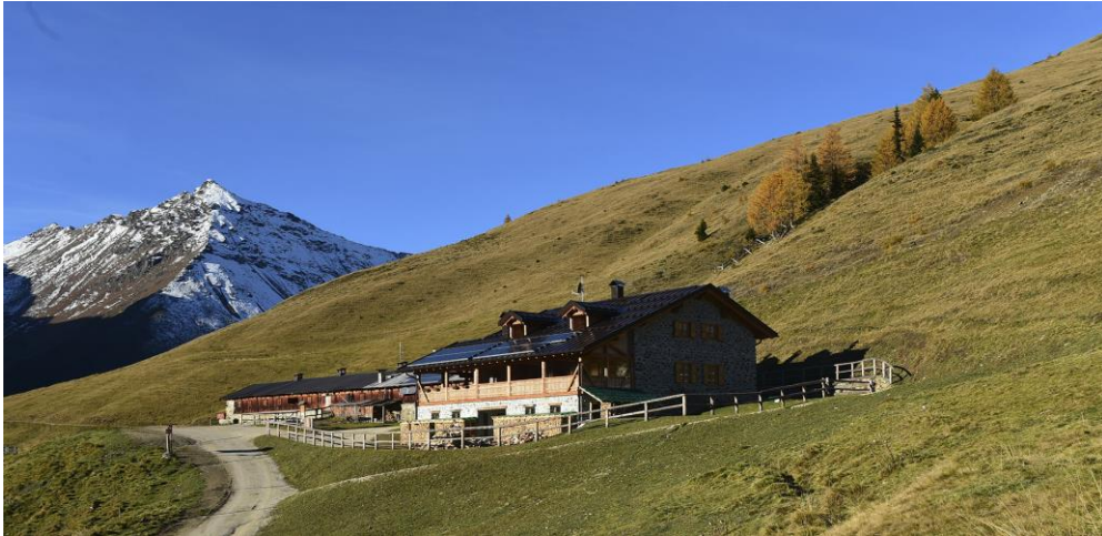
Malga Sole Alta

Grazie all'erba genuina, alle salubri acque dei rivi e all'ambiente incontaminato, viene così prodotto un latte prelibato con cui il casari realizzano i tipici prodotti della Val di Rabbi: ricotta, burro e formaggi, tra i quali spicca il morbido Casolet . Accanto alla loro forte essenza tradizionale molte malghe ad oggi sono diventate anche punti di ristoro. Sarà quindi possibile assaporare una ruralità genuina, frutto di elementi naturali.